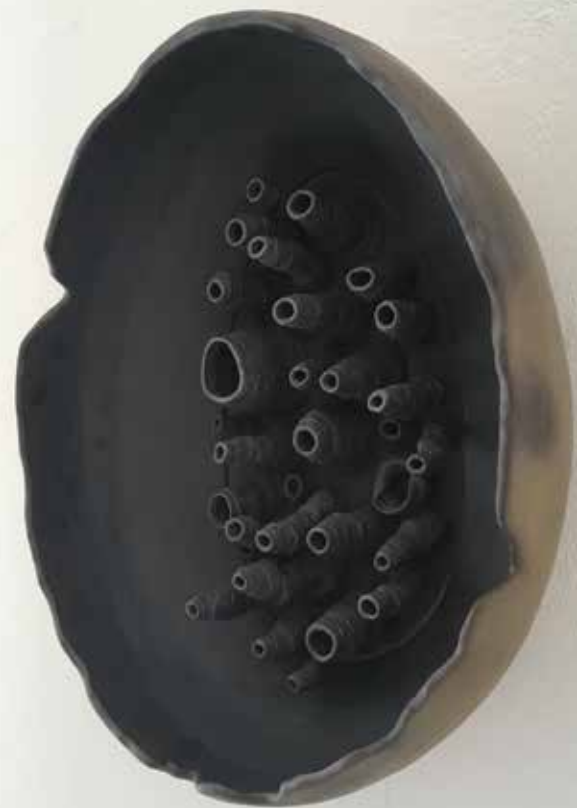
© Inès Lavalleye, Polype II, 2020. Porcelaine émaillée, diamètre 35 cm